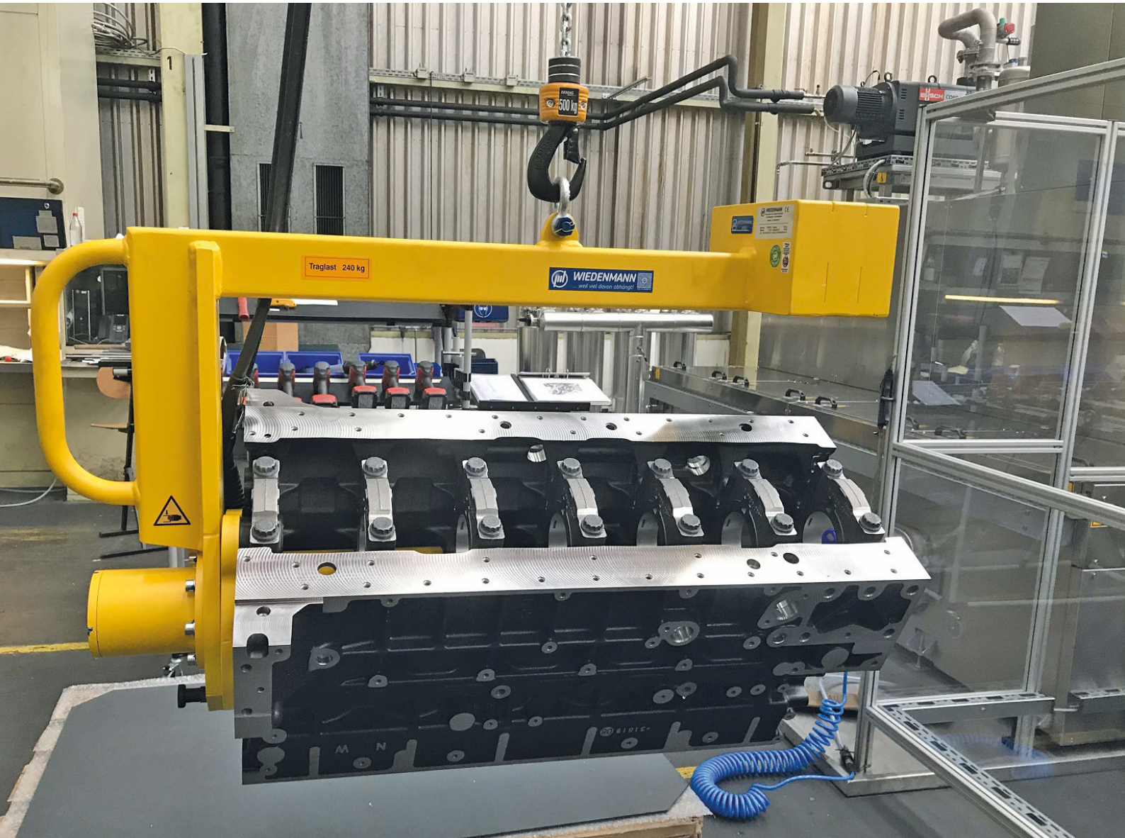
Hebe-Dreh-Greifer für die Handhabung von 240 kg schweren Motor-Kurbelgehäuse