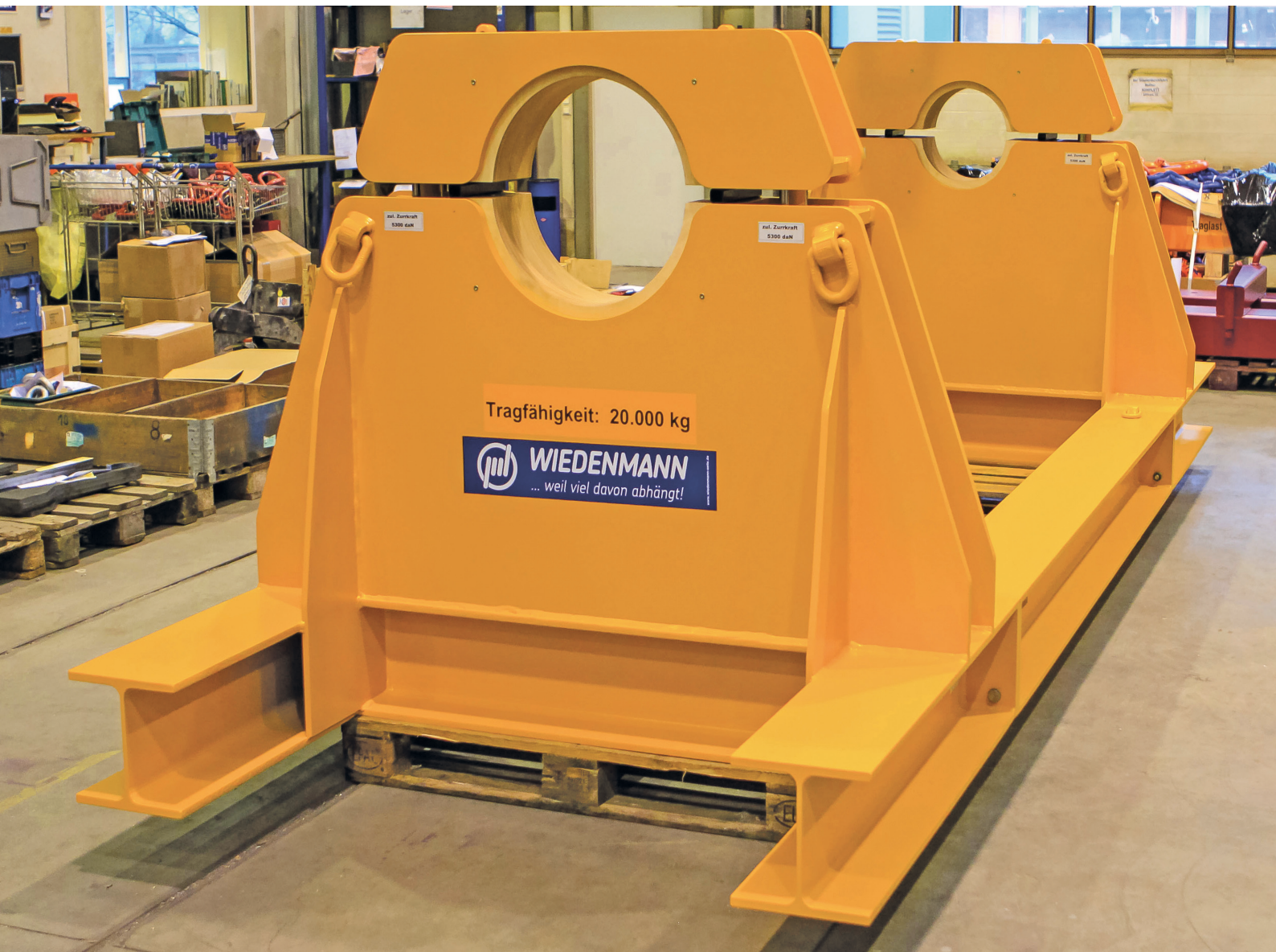
Transportgestell für einen Gasturbinenläufer