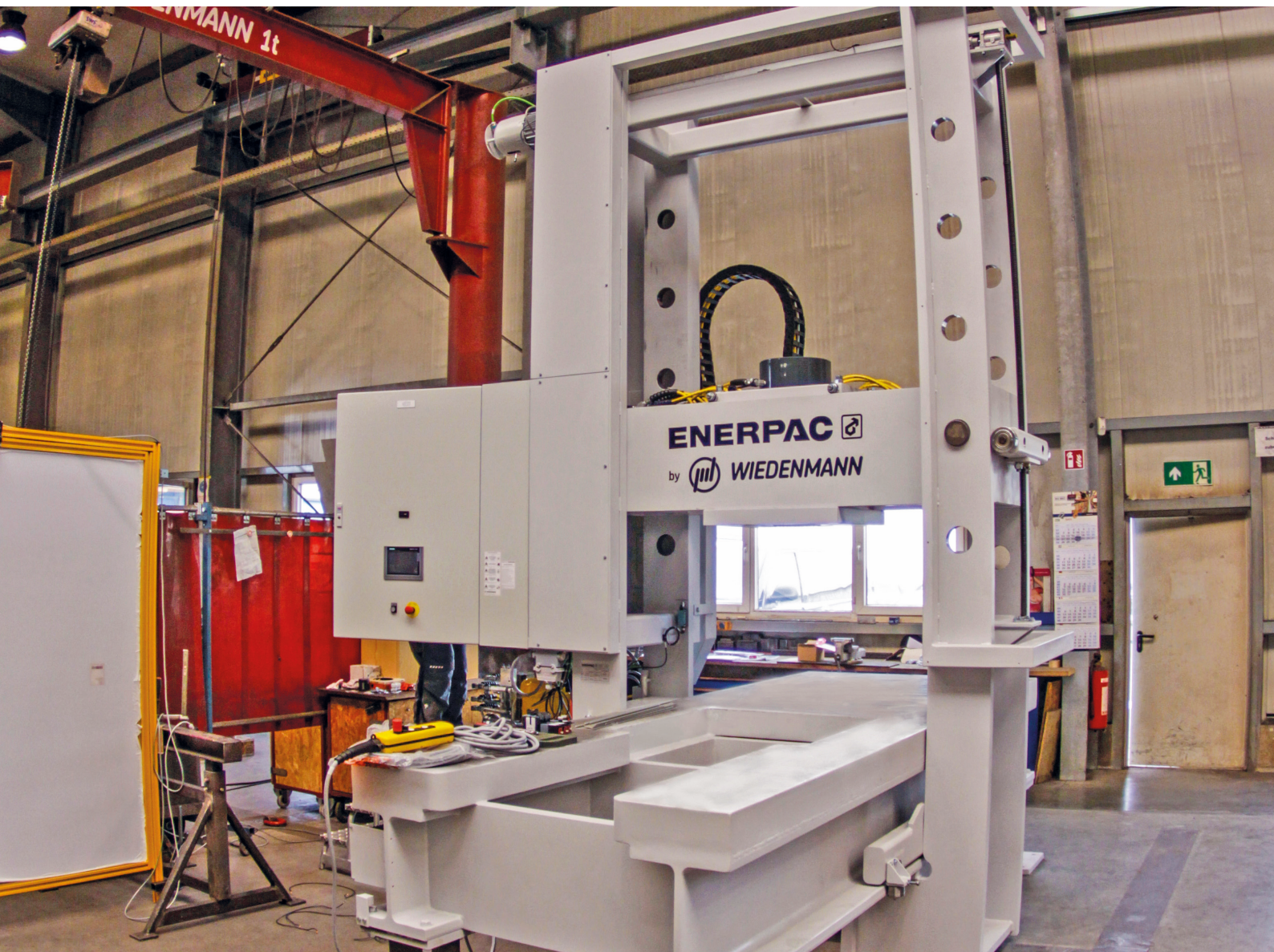
Rollrahmenpressen mit 3.036 kN Druckkraft und elektro-mechanisch einstellbarem Oberjoch