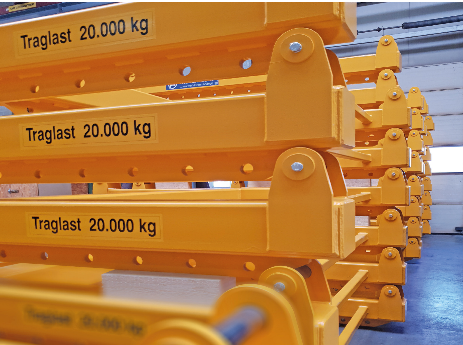
Kleinserie Lastaufnahmemittel zum Integration in eine kundenseitige Förderanlage in der Baumaschinenindustrie