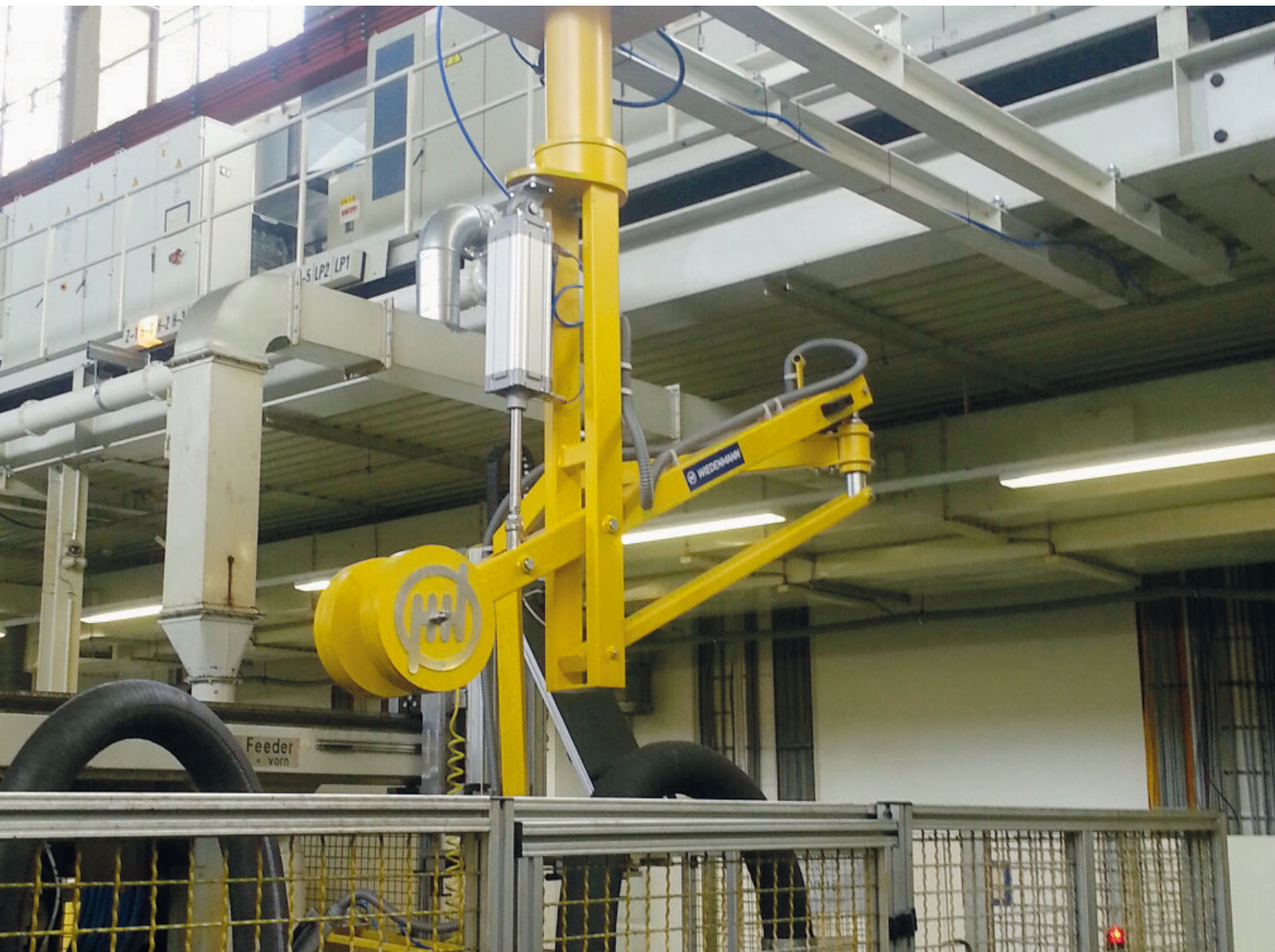
Pneumatischer Dreh-Knickarm zum Wechseln von Induktionsspulen