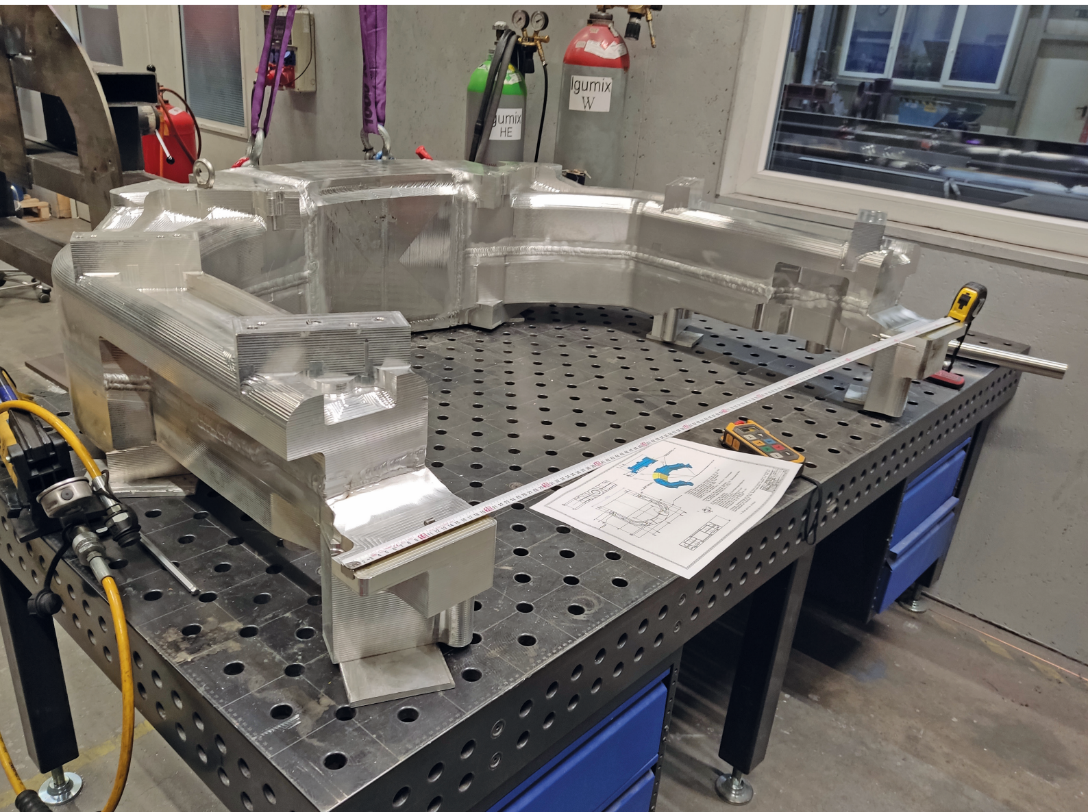
Schweißkonstruktion „Roboterarm“ aus einer AlMg(Mn) - Legierung