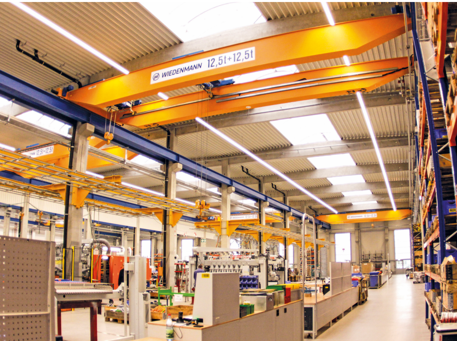
Kranbahnträger (in blau) sowie Krananlagen in einer Endmontagehalle