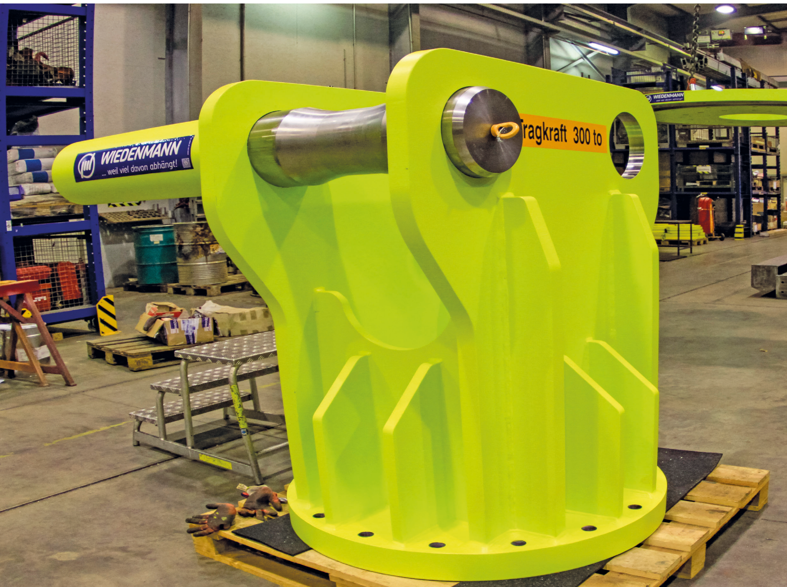
Hebevorrichtung mit 300 t Tragfähigkeit, für die Endmontage eines Wasserturbinen-Rotors