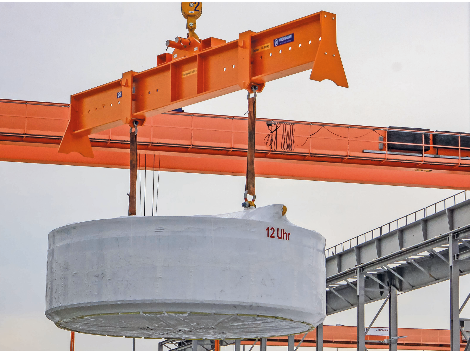
Verstellbare Krantraverse mit 70 t Tragfähigkeit zur Bauteilverladung für Windenergieanlagen