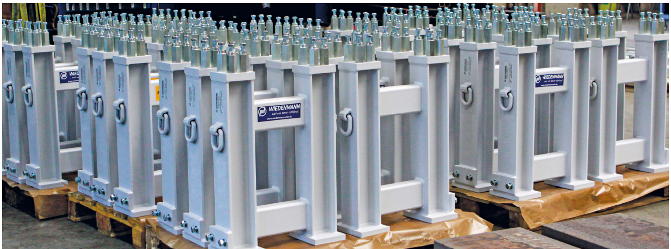
Stützkonstruktionen zum sicheren Abstellen von Zug-Antriebssystemen vor der Endmontage