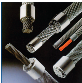
Seile & Zubehör