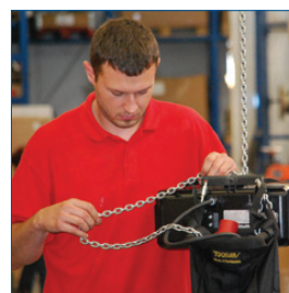
UVV & Reparaturen