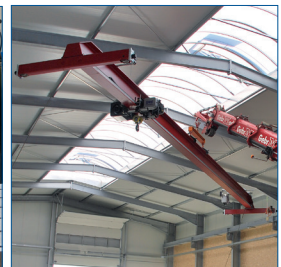
Kran- & Hebetchnik