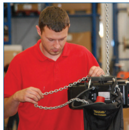
Prüfungen & Reparaturen