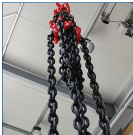
Ketten & Zubehör