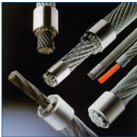
Seile & Zubehör