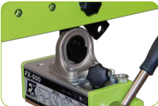
Schnell demontierbar zur Einzelverwendung