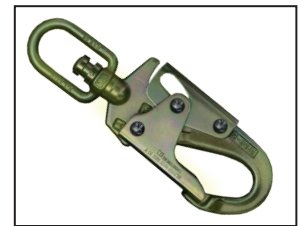
IKV 33 (ANSI Z.359.1-2007; CSA Z259.12-2011) mit Fallanzeiger