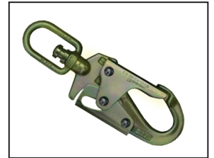
IKV 33 (ANSI Z.359.1-2007; CSA Z259.12-2011) mit Fallanzeiger