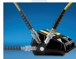
inkl. Drehanschluss XSC1